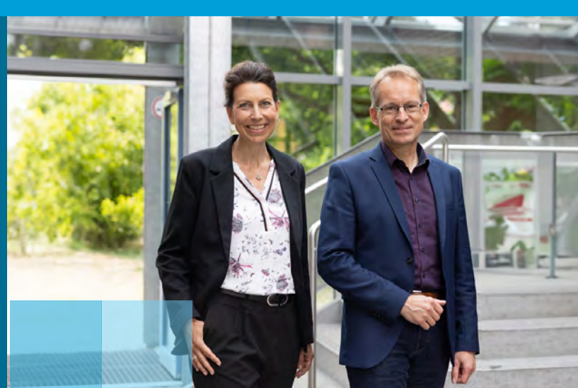
Leitung des RBZ Steinburg